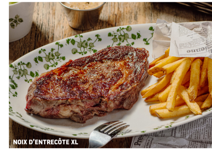
NOIX D'ENTRECÔTE XL