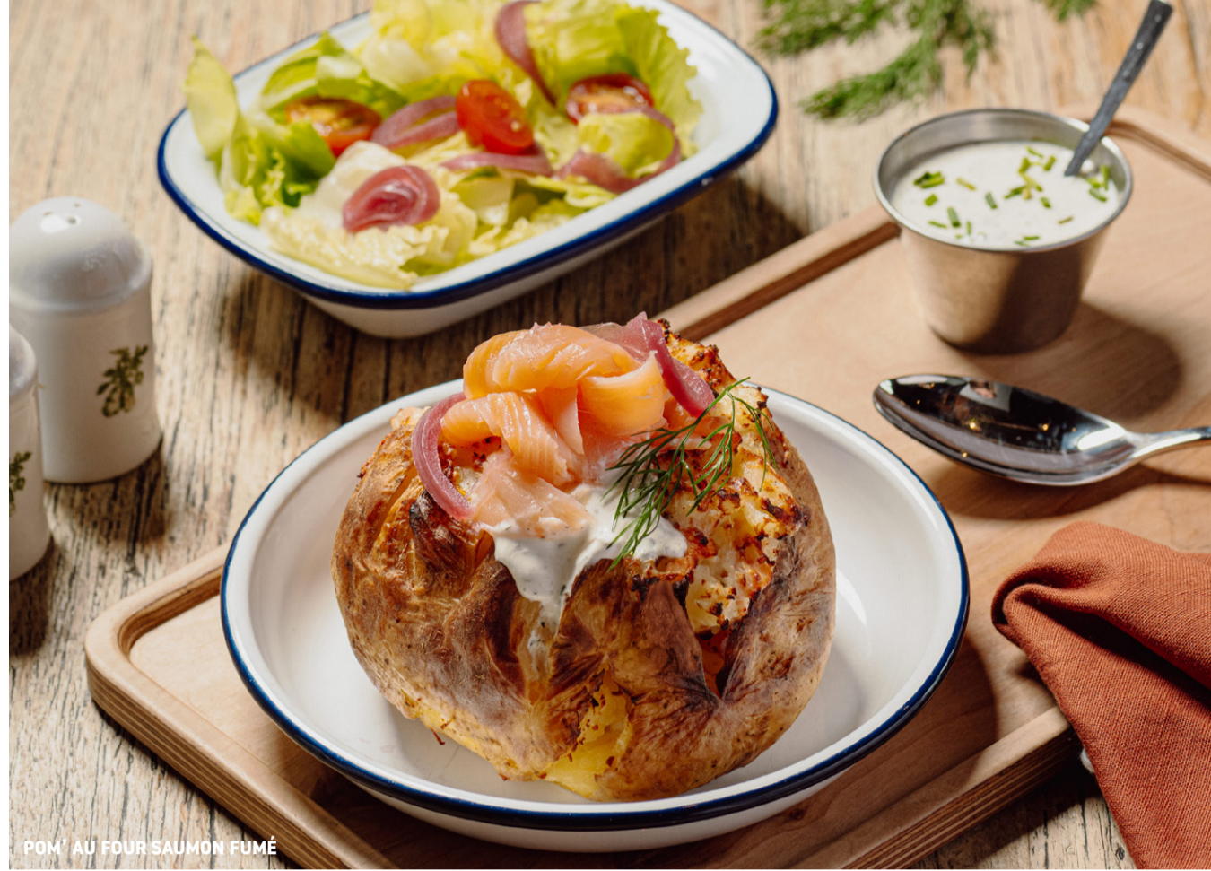
POM' AU FOUR SAUMON FUMÉ