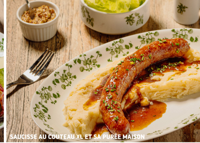
SAUCISSE AU COUTEAU XL ET SA PURÉE MAISON