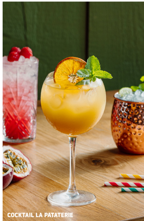
COCKTAIL LA PATATERIE