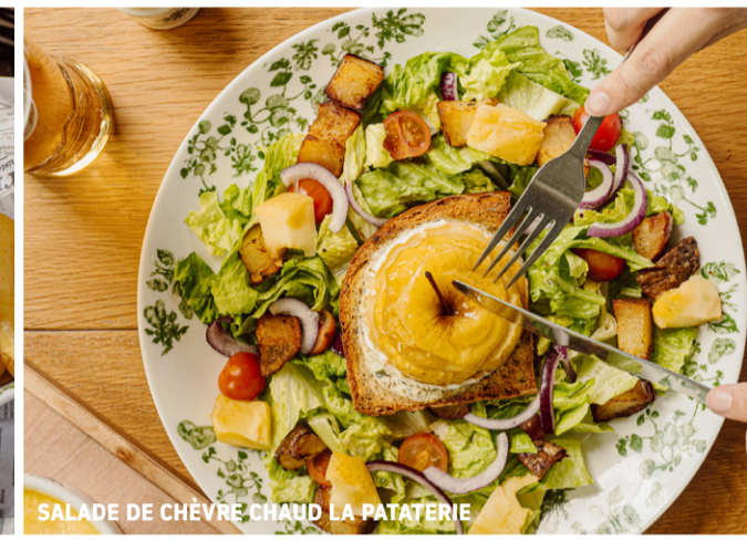
SALADE DE CHÈVRE CHAUD LA PATATERIE